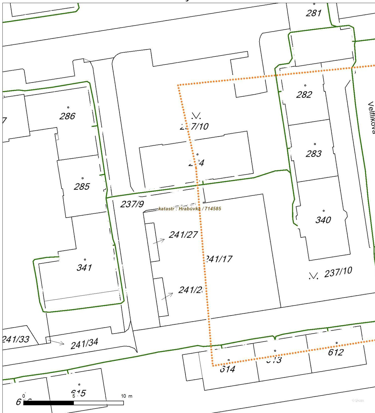
Situa ní výkres - list 1

Není-li zobrazena katastrální mapa, zadejte žádost znovu. Katastrální mapa je generována prostřednictvím externí WMS služby, jejíž provoz nezajišťuje společnost EZ Distribuce, a. s.